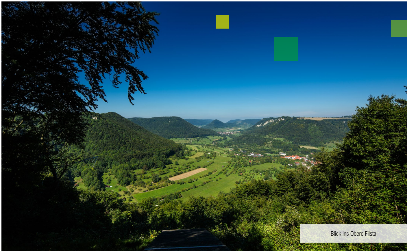
Blick ins Obere Filstal