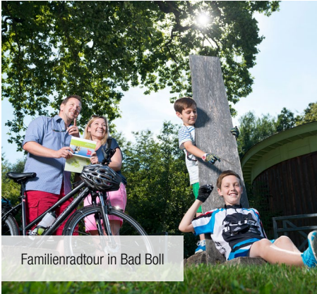
Familienradtour in Bad Boll