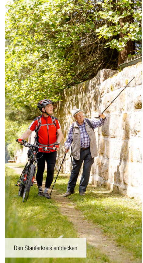
Den Stauferkreis entdecken