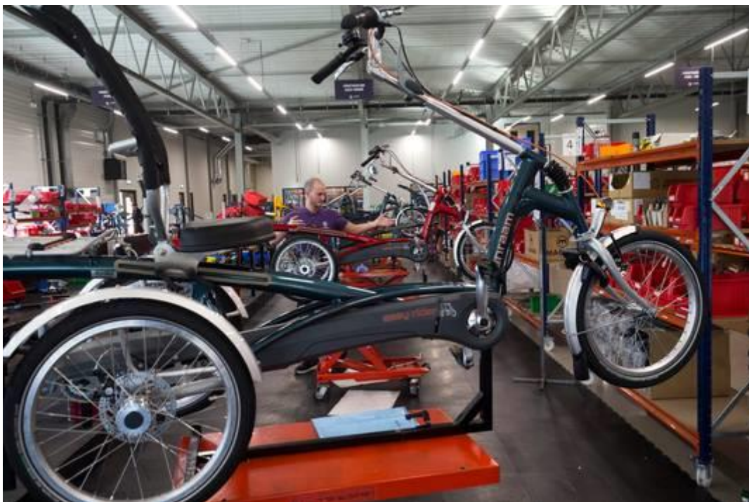
Een productielijn van Van Raam.

In feite zijn alle fietsen dus maatwerk. We leveren op aanvraag. Als iemand bijvoorbeeld geen armen heeft, wordt de fiets zo aangepast dat die met de romp te besturen is