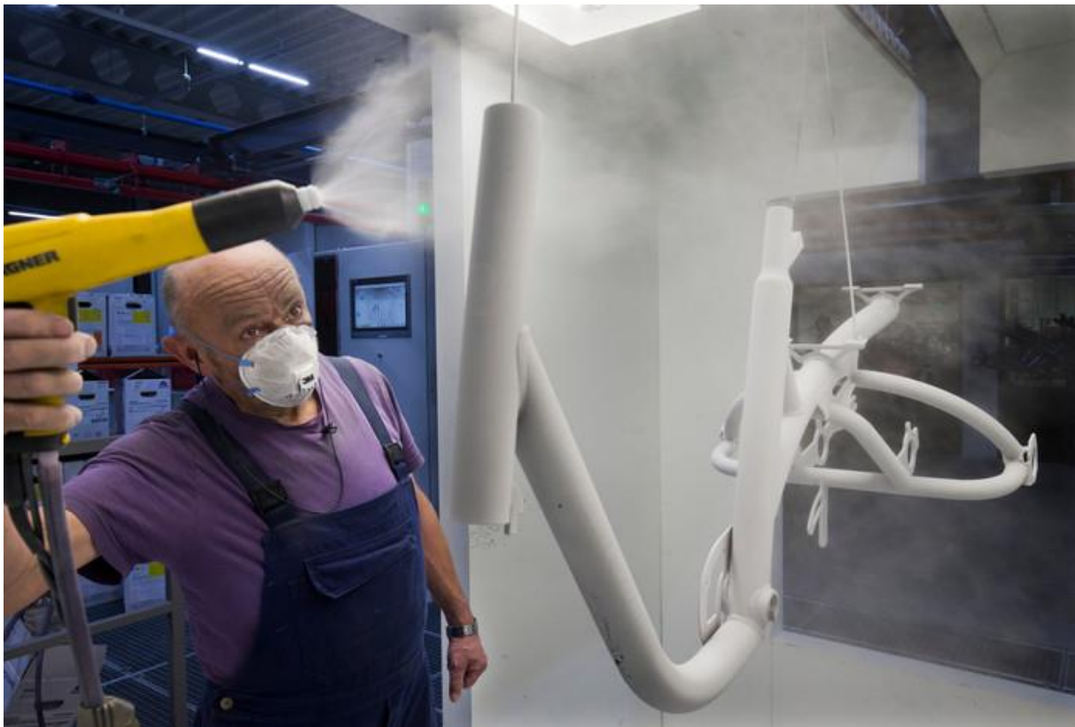
Ook het spuitwerk houdt het bedrijf in eigen hand.

Potentiële klanten kunnen bij het pand in Varsseveld op afspraak een testritje maken op de eigen testbaan van Van Raam. „Zo kunnen we meteen ter plekke bekijken welke opties wel of niet werken", zegt Kluivers. Speciale onderdelen worden in de fabriek zelf bedacht en bijvoorbeeld met behulp van een 3D printer in eigen huis gemaakt. „Het kost heel veel tijd en geld om zo te automatiseren", zegt ze. „Maar uiteindelijk betaalt het zich uit. In principe kunnen we alles hier maken."